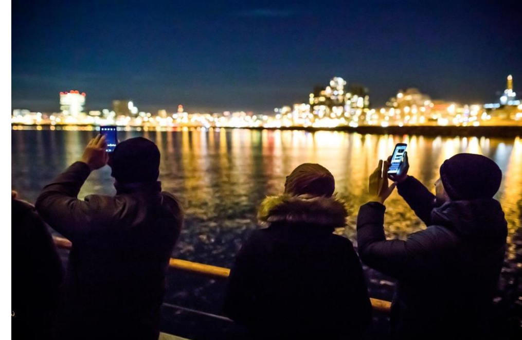
Reykjavík upplifuð frá Ópal

Ef við á er hægt að bæta kennileitum við í ferðavörðuna - eins og Norðursigling gerir á völdum dögum með Friðarsúluna eftir Yoko Ono.