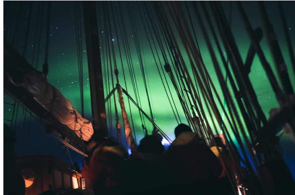
Tourists having a once-in-a-lifetime dark sky experience

Vefið saman menningar- og sögulegar frásagnir í ferðina, t.d. hægt að deila sögum frá stöðum sem farið er framhjá og þjóðsögum sem tengjast svæðinu.