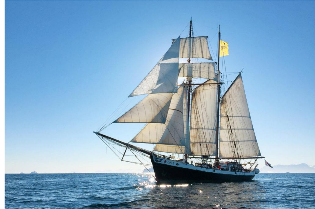
Ópal – hljóðlát rafknúin seglskúta

Þjálfuð starfsfólk og leiðsögumenn til að fræða gesti um umhverfisvæna þætti og mikilvægi ábyrgrar ferðapjónustu.