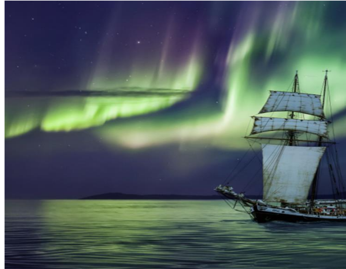
Ópal, rafknúinn seglbátur Norðursiglingar og dásemdarlegu norðurljósín

Í þessum fræðslupakka munum við rýna í hvernig hægt sé að skapa upplifun í vistvænni myrkurgæðaferðþjónustu! Þessi pakki var innblásinn af íslenska hvalaskoðunarfyritækinu Norðursigling, sem nýtti þau úrræði sem það hafði þegar yfir að ráða, svo sem rafknúinn seglbát og mannauð, til að skapa vel heppnaða upplifun í myrkurgæðaferðþjónustu: Norðurljósaferð með Ópal.