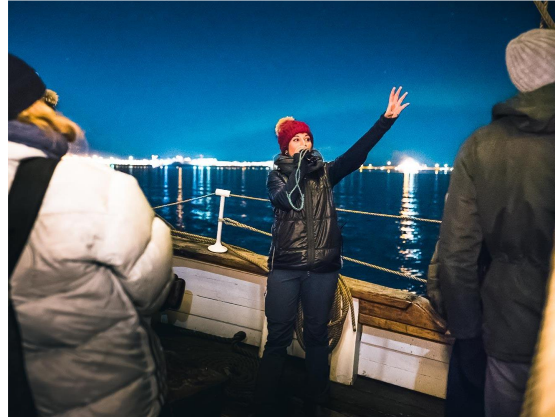
Leiðsögumaður Norðursiglingar að störfum

Bjóðið upp á alhliða pakka sem felur í sér fróðleiksríka leiðsögumenn, veitingar, hentugan klæðnað og annað sem nauðsynlegt er til að ferðin verði notaleg.